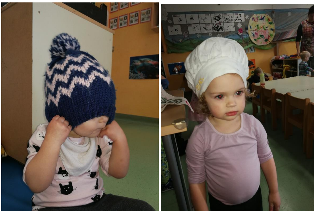
Fotografija 1,2: Ku, ku uganeš kdo sem? Taia me je poiskala in se mi pokazala.

Res je, pust je enkrat na leto, a naši/vaši malčki se radi preobrazijo tudi med letom, ko ni pustnega rajanja. V igralnici imamo na razpolago večje število pokrival in rokavic. Z vsem veseljem si preoblačimo kape in se opazujemo, se nastavljamo fotoaparatu, se smejemo ali pa mučimo sneti pokrivalo, ker nam ga je nadelala vzgojiteljica, nam pa ne prija. Igra s kapami je del igre s Fit pedagogiko, ki se imenuje Obleci me. Nekaterim je bilo preoblačenje premalo, zato so se lotili vzgojiteljčinih superg. Najbolj zanimivi so bili, ko so hoteli zavezati vezalke in so imeli veliko dela. Pohvaliti jih moram, saj so čakali na vrsto za superge in se počutili zelo pomembni, ko so jih končno lahko obuli. Nekonvencionalne in nestrukturirane igrače ali pa navadni predmeti so včasih najbolj zanimivi, tako je občasno tudi v vrtcu.