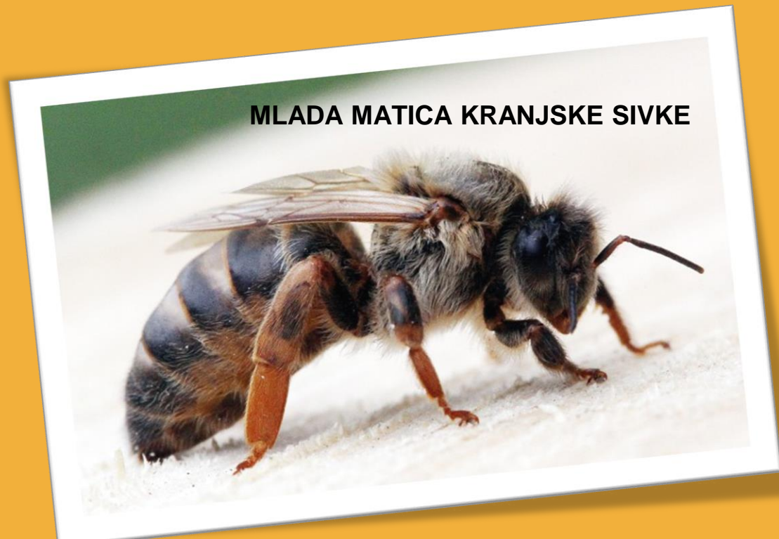
MLADA MATICA KRANJSKE SIVKE