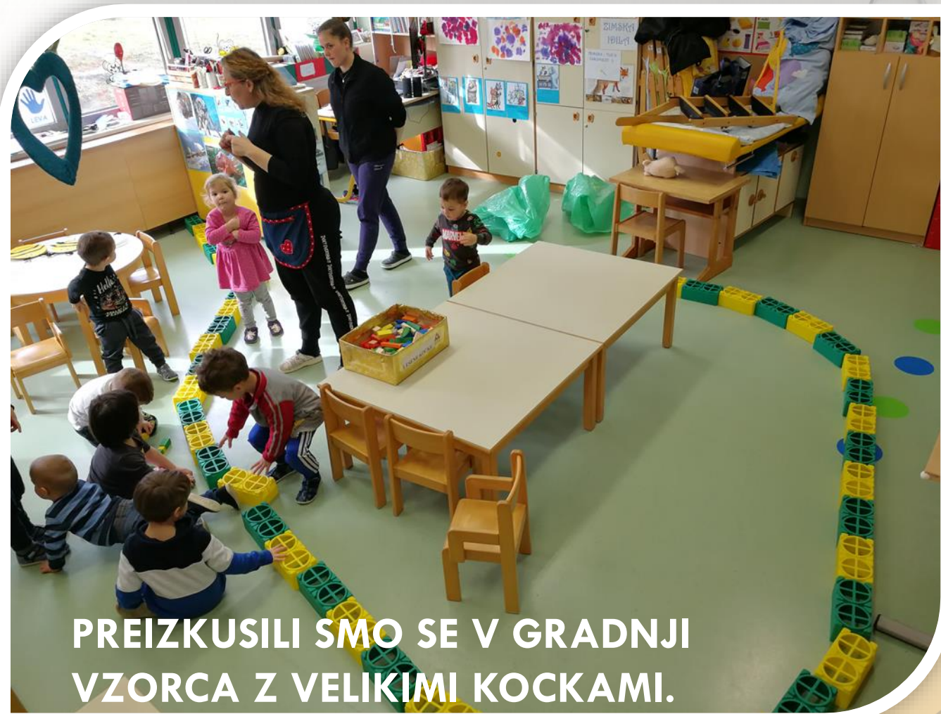
PREIZKUSILI SMO SE V GRADNJI VZORCA Z VELIKIMI KOCKAMI.